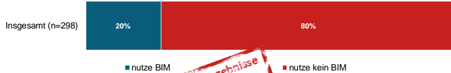
Anteil der BIM-Nutzer in 2017 (in %)