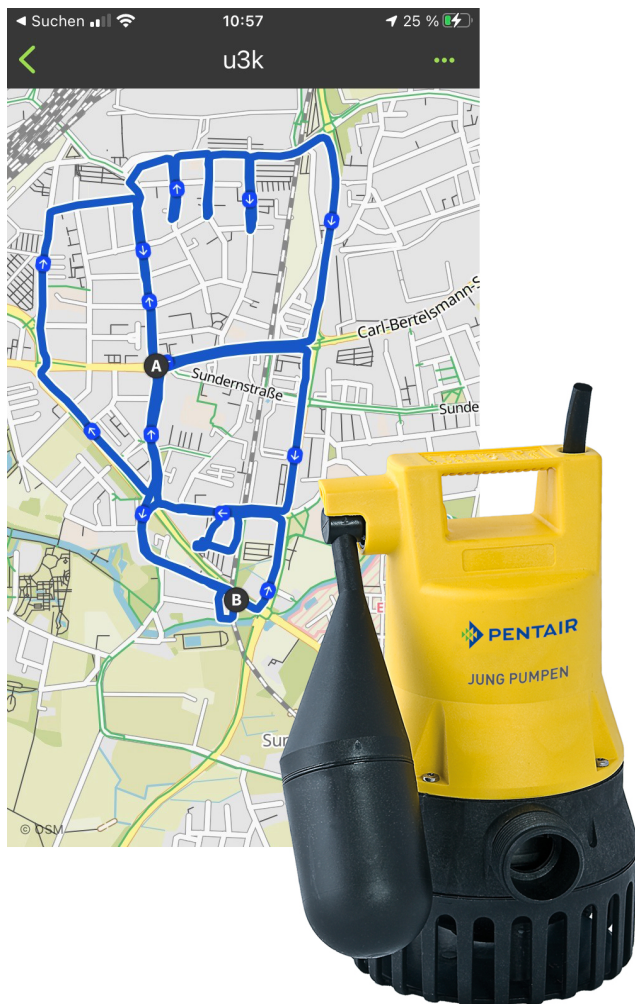
Bild 1: Product-Running: Eine Schmutzwasserpumpe U3K läuferisch nachgezeichnet in Gütersloh

bestehend aus Siebkorb, leistungsstarker Pumpe und Feuerwehrschauch - prämiieren. Also - mitmachen lohnt sich!