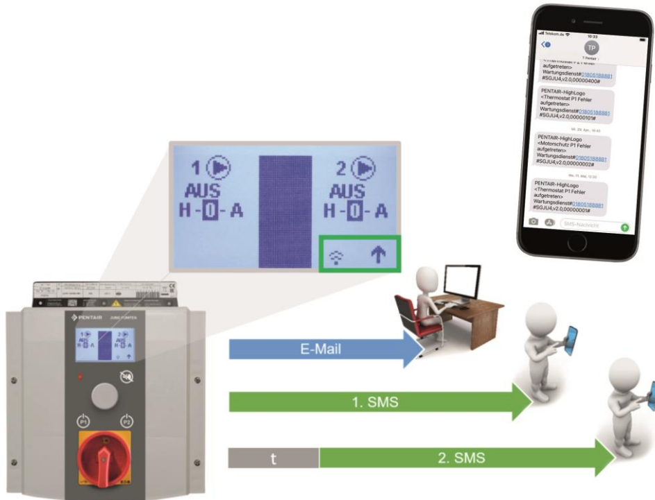
Bild 1: Das neue GSM-Modul ermöglicht im Störfall die Benachrichtigung von bis zu 3 Alarmempfängern per SMS oder E-Mail