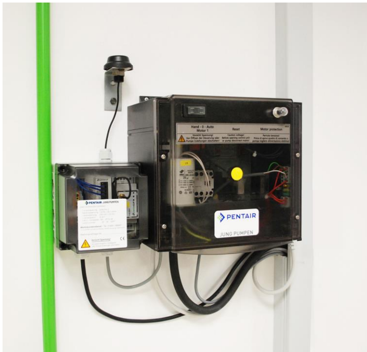
Bild 3: BasicLogo und ältere HighLogo-Steuerungen sowie Jung Pumpen-Produkte mit potentialfreiem Ausgang können mit dem GSM Pro 2-Modem remotefähig nachgerüstet werden.