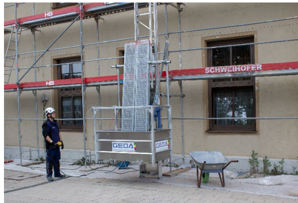
GEDA 200 Z