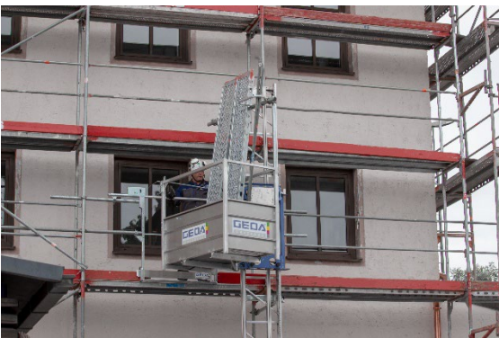
GEDA 200 Z