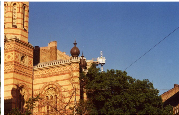
2000 - Ungarn, GEDA 500 ZP