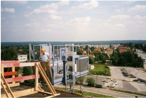
1997 – Baustelle Airport Dresden, GEDA 1200 ZP